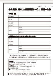
電話通訳サービスの 申込書

※2023年3月までにご登録済の医療機関はご利用にあたっての再申し込みは不要です。 ※登録前の緊急時利用の場合は、下記問い合わせ先（運営事務局）までご相談ください。