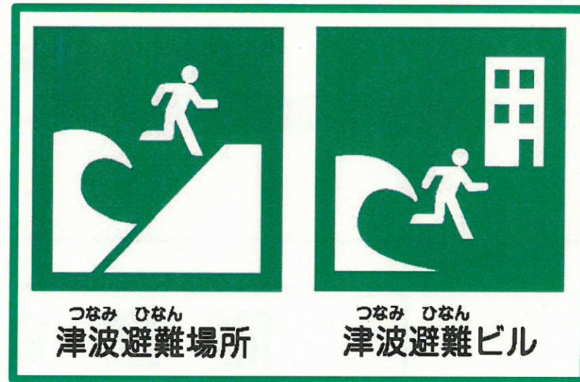
安全な避難場所表示