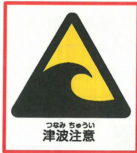
津波の来襲危険のある地域表示