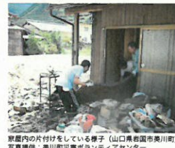
家屋内の片付けをしている様子(山口県岩国市美川町)