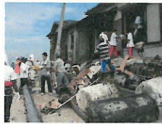
家屋内の片付けをしている様子（広島県呉市）

自治会役員や民生委員、地区社協の方など地域の状況を知っている人たちが、家々を回り、ボランティアの支援の依頼や、必要な人数などをとりまとめ、災害ボランティアセンターに伝えられました。数軒程度、お試みにボランティアに活動してもらい、ボランティアに手伝ってもらうことでメリットを紹介することができ、ニーズも増えたようです。