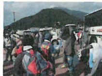
現地に到着したボランティアバスの様子