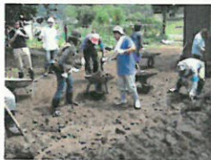
家屋周辺の片付けをしている様子（福井県）

地区・集落で継続してボランティア活動を行っている地元のボランティアリーダーが、自治会役員、民生委員などの方々と一緒になってニーズの把握を行い、その内容を災害ボランティアセンターへ伝えました。地元ボランティアリーダーの関わりによって、自治会役員、民生委員などの方々の負担を減らすことができ、また、被災地の地域性を十分に生かした救援活動となりました。