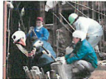
崩れた土壌の片付けをしている様子（石川県輪島市）