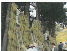
被災地で礫田の収穫を手伝っている様子（新潟県川口町）

行政（災害対策本部等）と災害ボランティアセンターが被災した地区・集落に現地本部を設置して、現地において行政、ボランティア、自治会役員など現地の状況を把握している方々と調整し、支援活動がスムーズに行われました。