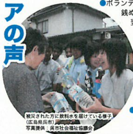
被災された方に飲料水を届けている様子(広島県呉市)