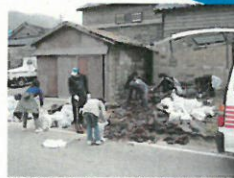
家屋周辺の片付けをしている様子（石川県輪島市）