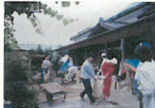
家屋内外の片付けをしている様子（宮城県）