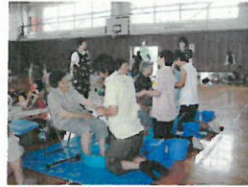
避難所での足湯の様子(新潟県刈羽村)