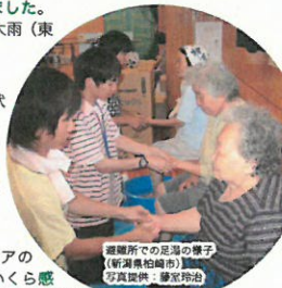
避難所での足湯の様子(新潟県柏崎市)