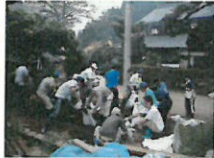
界隈周辺の泥だしをしている様子（福井県）