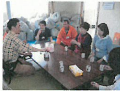
仮設住宅での地元ボランティアとの打合せの様子(石川県穴水町)