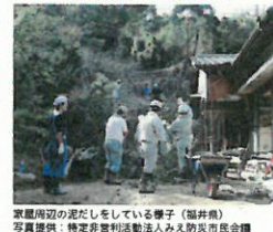
家屋周辺の泥だしをしている様子(福井県)