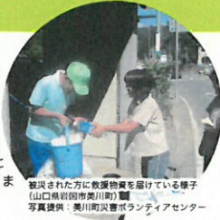
被災された方に飲料水を届けている様子(山口県岩国市美川町)