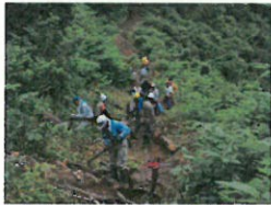
地震で崩れた里山の整備をしている様子(新潟県小千谷市)