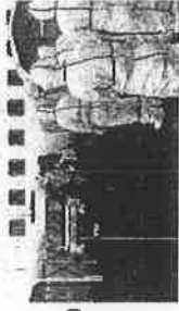
船内の患者を病院へ輸送する様子